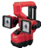
2122-21HD LÁMPARA DE DOS CABEZAS PARA CANASTA M18™ 2,500 LÚMENES