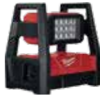
2360-20 REFLECTOR DE LUZ LED ROVER™ M18™ 3,000 LÚMENES