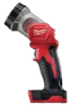
2735-20 LINTERNA M18™ 100 LÚMENES