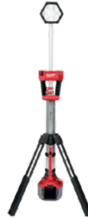
2131-20 TORRE DE LUZ ROCKET™ M18™ 2,500 LÚMENES