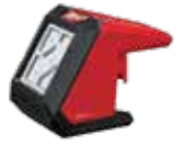
2364-20 LÁMPARA LED M12™ 1,000 LÚMENES