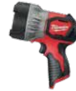
2353-20 LÁMPARA DE MANO M12™ 750 LÚMENES