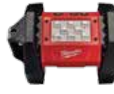
2361-20 REFLECTOR DE LUZ LED ROVER™ M18™ 1,500 LÚMENES