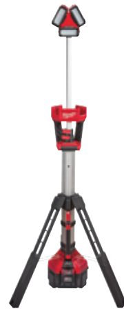
2135-21HD TORRE DE LUZ ROCKET™ M18™ 3,000 LÚMENES